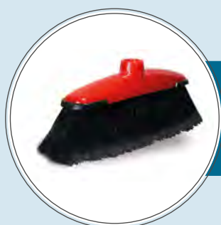
SCOPE E ATTREZZI