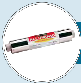
PLASTICA E PELLICOLA