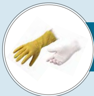
GUANTI IN LATTICE E NITRILE