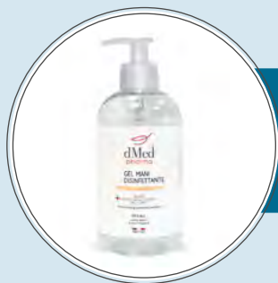
SAPONI E DETERGENTI