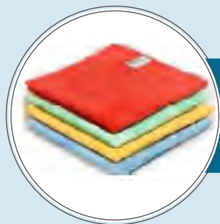
PANNI IN MICROFIBRA E ALTRO